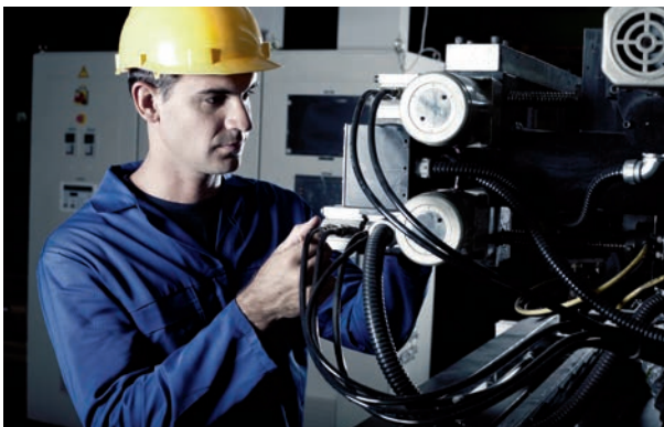
Robust und ausdauernd für den Einsatz in Industrie und Handwerk.

Von der kleinen Papierrolle drucken Sie auf rund 11 Me-tern Papier Text, Grafik, Barcode. Oder Sie bedrucken selbstklebende Etiketten, angenehm für das Auge, in 203 dpi Auflösung.