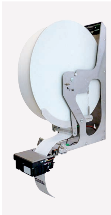
Mit einer Papierrolle von 300 mm Durchmesser verlängern sich die Wartungsintervalle spürbar. So reduzieren Sie Servicekosten.

mentschnitt. Dank der rostfreien Edelstahl-Schneidevorrichtung bleibt Ihre Komponente sowohl innen als auch außen korrosionsfrei, der Druckkopf hält humider Umgebung gut Stand. Der starke Drucker-Antrieb zieht von einem speziellen Halter Papierrollen mit einem Durchmesser bis zu 300 mm ohne Probleme. Das entspricht einem Papiervorrat von ca. 1 km.