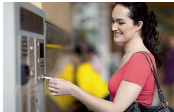
Schnell und outdoortauglich. Der GeBE-COMPACT Plus punktet mit hoher Druckgeschwindigkeit und robustem Aufbau. Sogar 12 V Solarstrombetrieb ist möglich.